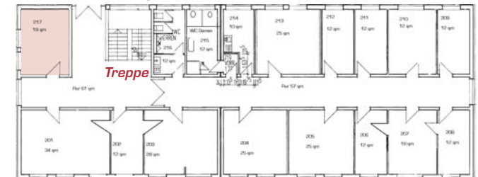
Haus 3, Obergeschoss

take-off GewerbePark TUTTLINGEN | NEUHAUSEN OB ECK