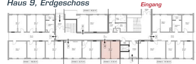
Haus 9, Erdgeschoss

take-off GewerbePark TUTTLINGEN | NEUHAUSEN OB ECK