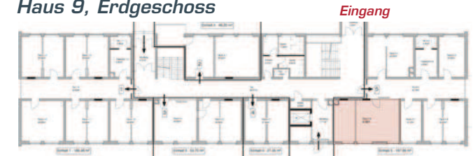
Haus 9, Erdgeschoss

take-off GewerbePark TUTTLINGEN | NEUHAUSEN OB ECK